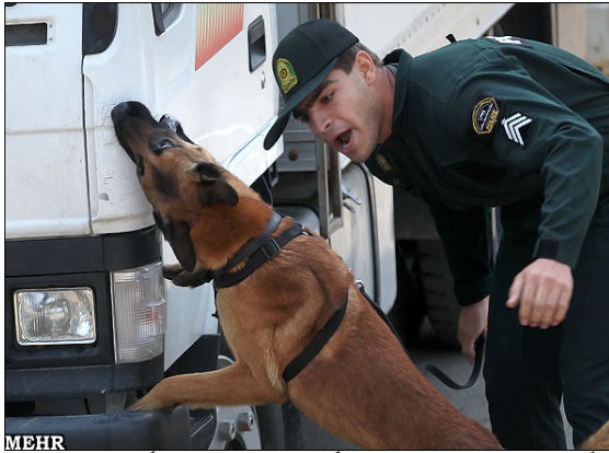
سگ های موادیاب در ایران در گشت بازرسی

ایران در عین حال عضو سازمان همکاری اقتصادی، یک سازمان منطقه ای دولتی است که اعضای دیگر آن افغانستان، آذربایجان، قزاقستان، قرقیزستان، تاجیکستان، ترکیه، ترکمنستان و ازبکستان هستند. دبیرخانه سازمان همکاری اقتصادی که در تهران مستقر است، دارای یک واحد هماهنگی کنترل مواد مخدر است. اتحادیه اروپا مبلغ 9/5 میلیون یورو در سه سال برای طرحی تامین کرده که هدف از آن تقویت همکاری منطقه ای ضد مواد مخدر بین اعضای سازمان همکاری اقتصادی با دربرگرفتن ایران، افغانستان و پاکستان است. یک بخش از این طرح شامل حمایت پلیس جمهوری فدرال آلمان در برپا کردن آزمایشگاه های قانونی در منطقه برای «مواد مخدر، مواد اولیه و اسناد جعلی» و احتمالاً انواع دیگر مدارک و شواهد است. 21