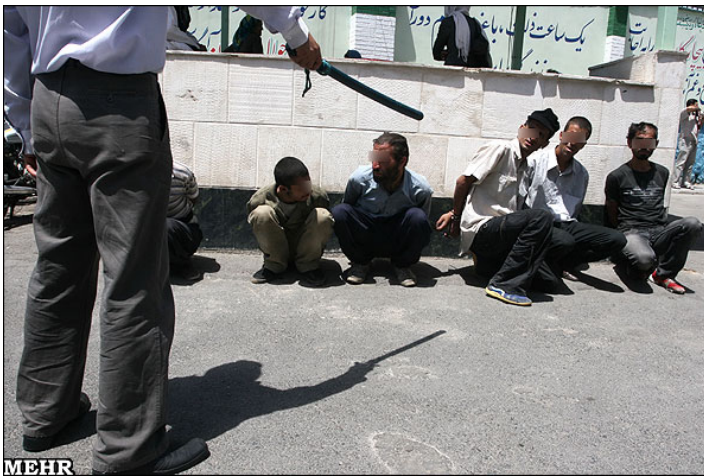
پلیس ایران معتادان را در خرداد 1390 دستگیر کرده است

قانون اصلاح شده باز هم به جای مجرم دانستن معتادان به مواد مخدر، راه هایی را برای بازپروری و اصلاح آنها ارائه می کند. بر اساس ماده 15 و 16، معتادان به مواد مخدر باید در مراکز دولتی و مجاز درمان و کاهش آسیب در پی درمان باشند. معتادان دارای گواهی تحت درمان و کاهش آسیب از مجازات های این قانون معاف هستند. معتادانی که دارای این گواهی نباشند به دستور قضایی به مدت شش ماه به یکی از مراکز اعزام خواهند شد. به درخواست مرکز یا فرد و توافق مرکز این مدت را می توان سه ماه تمدید کرد. در این مدت، پیگرد قضایی آن فرد معلق خواهد شد. در صورتی که مرکز گزارش دهد که فردی با موفقیت دوره درمان را گذرانده، پیگرد متوقف خواهد شد. اما، برخلاف قانون قبلی، در مورد معتادانی که درمان نشوند تعقیب قضایی پیش بینی شده است. 38 مجازات های پیش بینی شده شامل زندان، جریمه یا شلاق است.